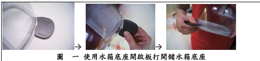
圖一 使用水箱底座開啟板打開儲水箱底座